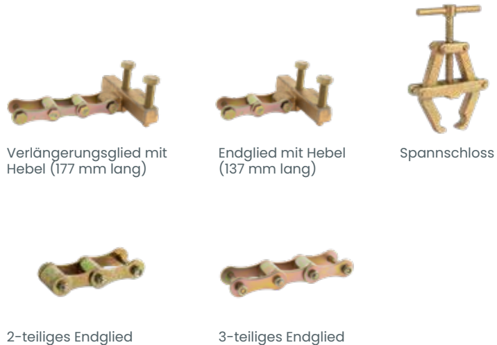
Verlängerungsglied mit Hebel (177 mm lang)