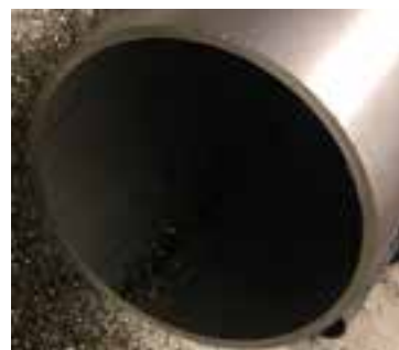
Schnitt 115 x 5 mm