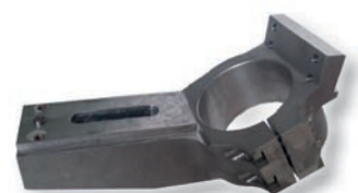
Rohrabschrägvorrichtung KIT 30°