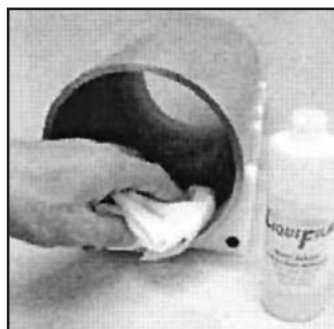
Schritt 2: Wasserlöslichen Folienkleber auf das Rohr auftragen.