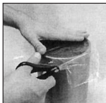
Schritt 3: Wasserlösliche Folie kreisrund ausschneiden. Kreis sollte 76 mm größer als der Rohrumfang sein.