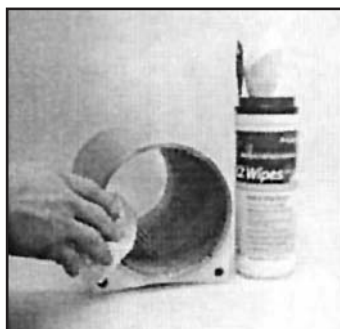
Schritt 1: Rohr säubern.